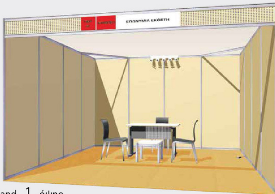
Stand 1 όψης